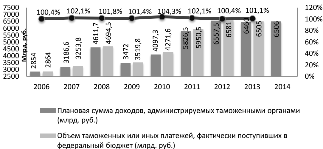
Рис. 1. Динамика перечислений таможенных платежей в доход федерального бюджета

2010 года) – это видно из динамики перечислений таможенных платежей в доход федерального бюджета в 2006–2014 годах – Рисунок 1.