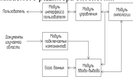
Рис. 2. Структурная схема

В соответствии с задачами и требованиями, которые должен решать программный продукт наиболее подходящей средой проектирования является Visual Studio и язык программирования C#. На рисунке 2 представлена структурная схема разрабатываемого редактора онтологии.