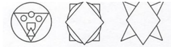
Рисунки 3, 4, 5

Например, Круг и треугольник лежат в основе композиции «Троицы» (рис.3); круг и квадрат – символ соединения Божественного и человеческого (рис.4); Шестиконечное ( восьми-) очертание лучей фаворского света связано с темами преображения и искупления земного мира, и с торжеством жизни грядущего века в восьмой День Вечности.( рис. 5)