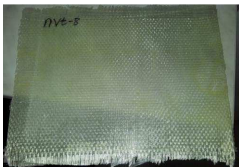
Рис. 2. Стеклопластик на основе полидициклопентадиена

В качестве катализатора Ховейды-Граббса второго поколения использовался катализатор метатезисной полимеризации, представляющий собой (1,3-бис-(2,4,6-триметилфенил)-2-имидазолидинилиден)дихлоро(о-N,N-диметиламино-метилфенилметил)- рутений, который разработан компанией НИОСТ в городе Томске. Этот катализатор способен контролировать процессом полимеризации и также стабилен при хранении, устойчив при контакте с кислородом и влагой воздуха. Используемый катализатор позволяет получать полидициклопентадиен при мольном соотношении мономер: катализатор от 75000:1 до 100000:1 [4].