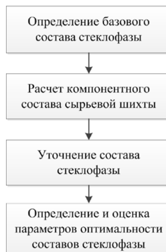
Рис. 1 Схема определения оптимальных составов стеклогранулята

параметров оптимальности, судили о пригодности химического состава синтезируемого стекла.