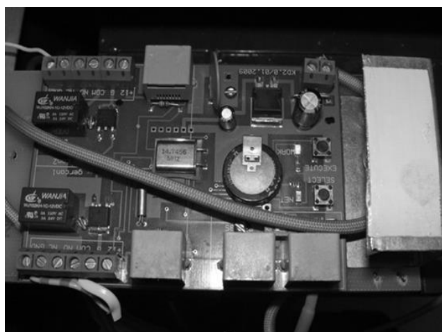
Рис. 3 Контроллер управления электроприводом положения рейки топливного насоса

Внешний вид контроллера управления электроприводом показан на рис.3.