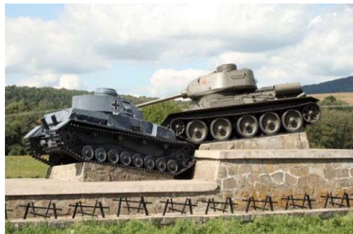
Фото 8. Монумент «Танковый таран»

Особенно много таранов было совершено советскими танкистами во время Курской битвы. Только 12 июля 1943 г. под Прохоровкой было совершено более 20 таранов, а за все время битвы – более 50. Ударам подвергались не только легкие и средние танки, но и новейшие «тигры» и «пантеры», превосходившие советские танки по массе, вооружению и бронированию [3].