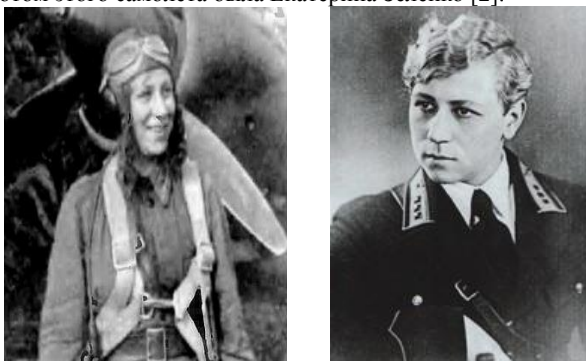
Фото 5. Екатерина Ивановна Зеленко – Герой Советского Союза

12 сентября 1941 года над селом Анастасьевка Сумской области произошел уникальный случай – в бою советского легкого бомбардировщика Су-2 с семью немецкими «мессершмиттами» один был сбит огнем, а второй уничтожен тараном. Пилотом этого самолета была Екатерина Зеленко [2].