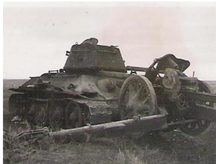
Фото 7. Танк Т-34 в момент тарана пехотного орудия

24 декабря 1942 года, во время Сталинградской битвы, танкисты 1-го танкового батальона 54-й бригады капитана С. Стрелкова и 2-го танкового батальона 130-й бригады М. Нечаева уничтожили около 350 самолетов на аэродромах и железнодорожных станциях на эшелонах, что способствовало разрушению «воздушного моста», по которому снабжалась группировка Паулюса. Также тараны против самолетов были применены 28 марта 1944 года, тогда было уничтожено 30 самолетов. 17 января 1945 года на аэродроме возле польского города Сохачев было уничтожено 20 самолетов.