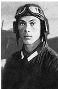
Фото 1. Гастелло Николай Францевич – Герой Советского Союза

Во время Великой Отечественной войны немецкие лётчики столкнулись с таким приемом как воздушный таран. Этот приём впервые был предложен русским авиатором Н. А. Яцуком (в журнале «Вестник воздухоплавания» № 13-14 за 1911 год), а впервые был применен русским лётчиком Петром Нестеровым 8 сентября 1914 года, когда он сбил австрийский самолёт-разведчик.