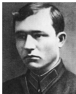
Фото 4. Лейтенант А. М. Кижеватов – Герой Советского Союза

Это стихотворение написал неизвестный защитник Брестской крепости в 1941 году. Оно было найдено в разрушенной крепости.