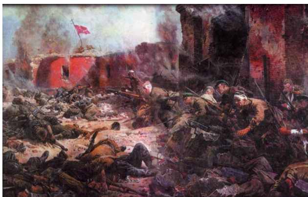
Фото 1. Защитники Брестской крепости (художник П. Кривоногов)

Данное «Боевое донесение о занятии Брест-Литовска» было переведено на русский язык, и некоторые выдержки из него были опубликованы в газете «Красная звезда» в 1942 году. Таким образом, фактически из вражеских уст, советские люди впервые узнали кое-какие подробности поразительного подвига героев Брестской крепости.