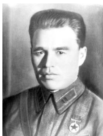
Фото 2. Майор П. М. Гаврилов – Герой Советского Союза

В районе Северных ворот в течение двух дней оборону держали красноармейцы из разных подразделений под руководством командира 44-го стрелкового полка майора П.М. Гаврилова (фото 2). 24 июня защитники северной части главного вала перешли в Восточный форт. Гаврилов сумел сплотить часть гарнизона – около 400 человек, и наладил оборону. Там находились красноармейцы 393-го отдельного зенитно-артиллерийского дивизиона, транспортная рота 333-го стрелкового полка, учебная батарея 98-го отдельного противотанкового артиллерийского дивизиона, и бойцы некоторых других частей. Были организованы наблюдательный и командный пункты, налажено взаимодействие отдельных участков обороны. В земляных валах прорыли окопы, установили пулемётные точки. Форт стал практически неприступным. Сами фашисты отмечали: «Сюда нельзя было подступиться, имея только пехотные средства, так как превосходно организованный ружейный и пулемётный огонь из глубоких окопов и подковообразного двора скашивал каждого приближающегося».