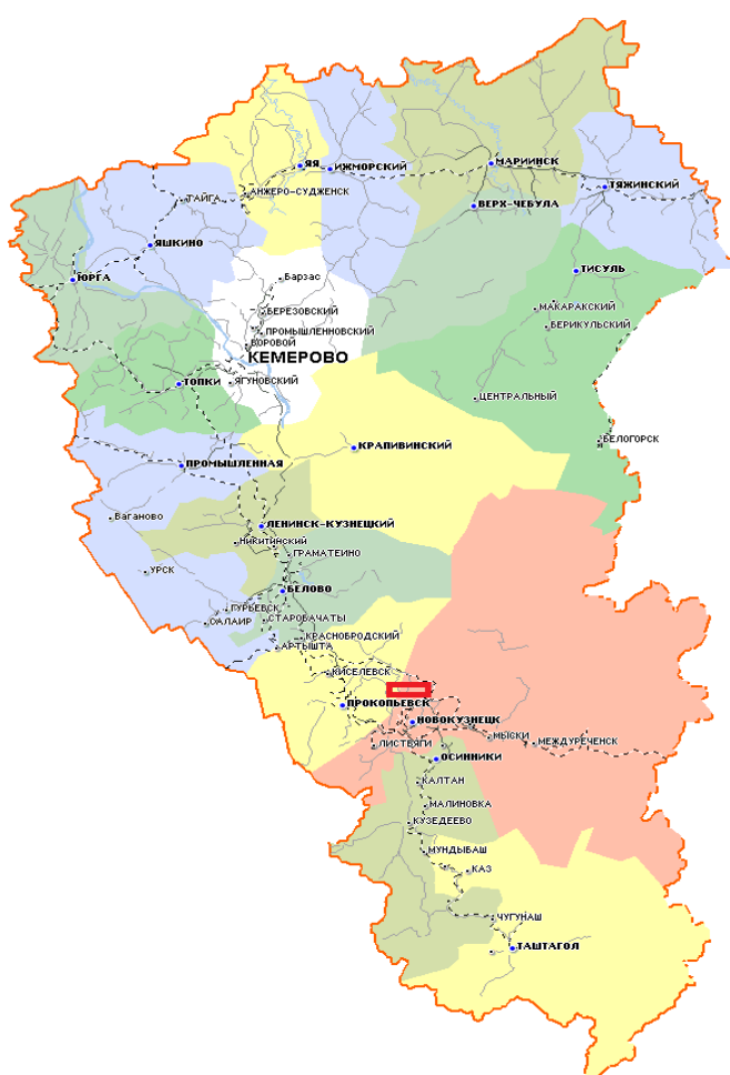
Рисунок 1.1 – Обзорная карта района работ. Масштаб 1:3000000 [1]

По административному положению участок изысканий находится на территории Прокопьевского района Кемеровской области. Ближайшие населенные пункты – д.Котино, д. Соколово и с. Терентьевское. (рисунок 1.1).