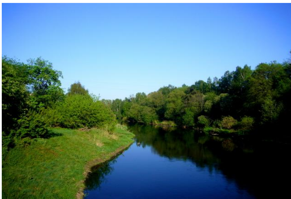
Рисунок 1.2 – Река Верхняя Тыхта

Гидрографическая сеть территории представлена такими реками как р. Каракчата, которая является правым притоком р. Верхняя Тыхта (рисунок 1.2).