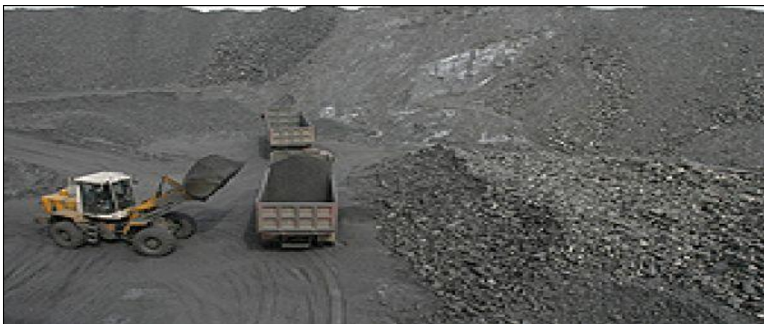
Рисунок 1.4 – Месторождение угля

Полезные ископаемые района представлены месторождениями угля (рис. 1.4). Угленосность Ерунаковского геолого-экономического района связана с отложениями ерунаковской подсерии (тайлуганская, грамотеинская и ленинская свиты) и ильинской подсерии (ускатская и казанково-маркинская свиты) [2].