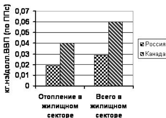
Рис. 2. Показатели энергоемкости энергопотребления и отопления в жилищном секторе в России и Канаде

В [4] приведено сопоставление ещё пяти пар стран, которые находятся в очень близких климатических условиях, с примерно одинаковой плотностью населения, размерами территорий и т. д. (Эстония – Финляндия, Австрия – Чехия, Болгария – Италия, Украина – Германия, Южная Корея – Северная Корея). Показано, что страны, которые шли по пути жесткого административного управления, централизованного планирования, как минимум в 2 раза менее энергоэффективны, чем страны с рыночной экономикой. Из этого следует естественный вывод, что высокой энергоемкостью экономики Россия платит не только за «холод», но и за «неволю».