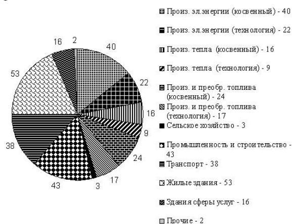
Рис. 4. Распределение потенциала энергосбережения по секторам экономики

Удельный потенциал энергосбережения различен для этих секторов и поэтому его распределение не пропорционально объемам энергопотребления, рис. 4.