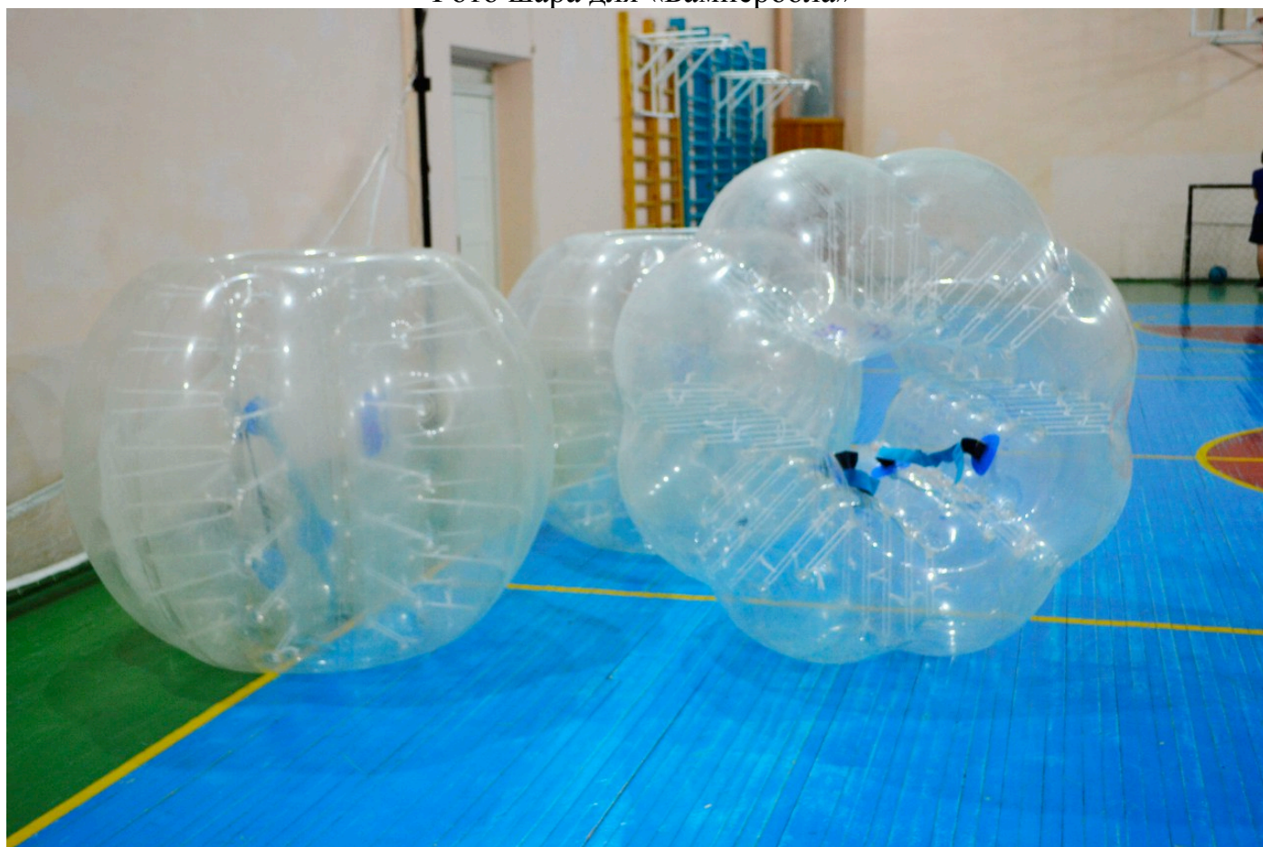
Фото шара для «Бампербола»