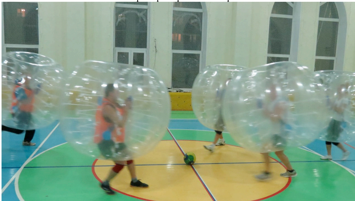
Фото примера игры в «Бампербол»