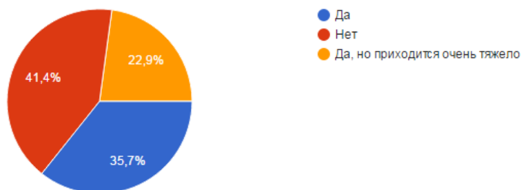
Рисунок 4 - Структура ответов на вопрос

4) Хватает ли Вам своего дохода на месяц? (70 ответов)