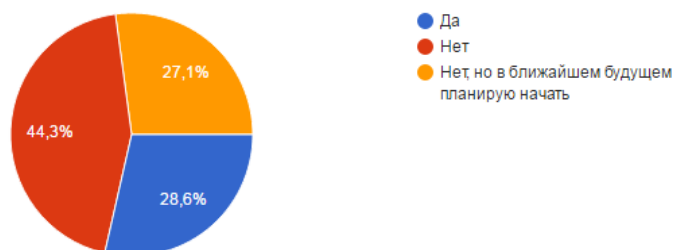
Рисунок 3 - Структура ответов на вопрос

3) Работаете ли Вы в данный этап своей жизни? (70 ответов)