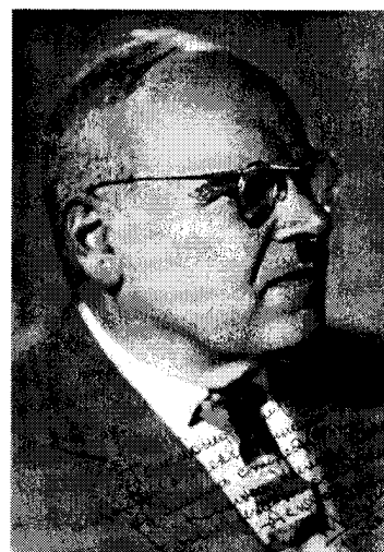
Н.И.Камов, выдающийся авиаконструктор, выпускник МСФ 1923 г.