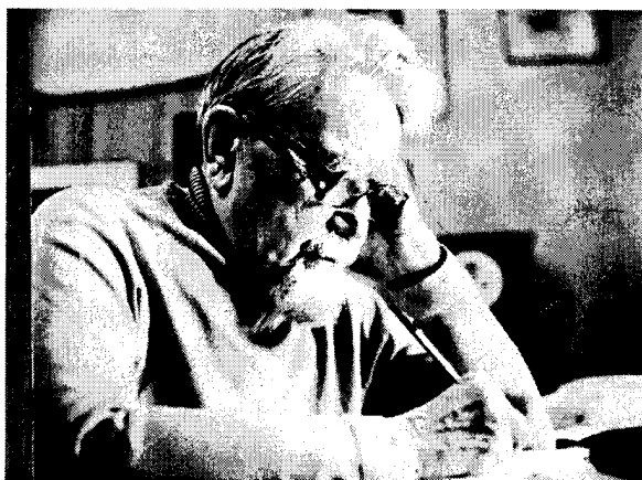
А.П.Казанцев, писатель- фантаст, выпускник МСФ 1930 г.