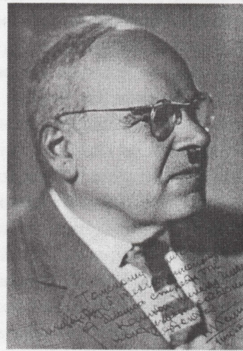
Н.И.Камов, выдающийся авиаконструктор, выпускник МСФ 1923 г.