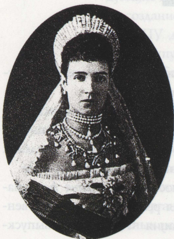
Государыня Императрица Мария Федоровна

турного наследия народов России. Это признание вклада многотысячного коллектива томских политехников за весь столетний период деятельности вуза в экономическое и культурное развитие России.