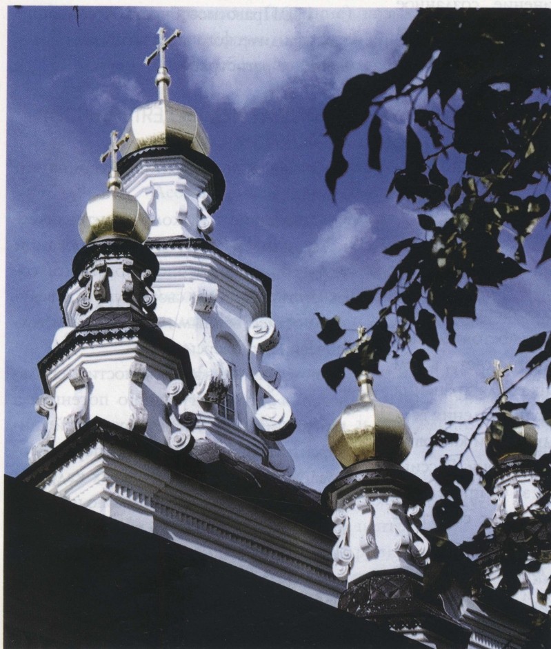
Фрагмент куполов храма Богородице-Алексеевского монастыря в Томске.