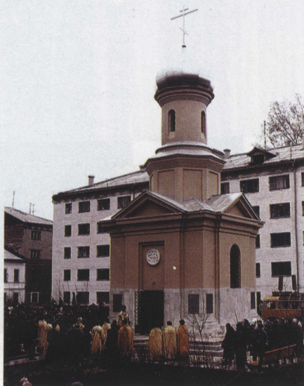
Освещение часовни Святой Домны Томской в момент ее открытия. 14 мая 1996 г.

Прошло десять лет как Томский политехнический стал университетом. С благославения Святейшего Патриарха Московского и Всея Руси Алексия II, поддержавшего идею гуманизации технического образования и посетившего ТПУ в мае 1991 года, в Томском политехническом многое делается для духовного возрождения традиций старейшего вуза в Сибири.