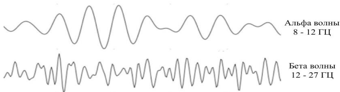
Рисунок 2 – Альфа и бета волны

и активных мыслительных процессах частота сигнала изменяется в пределах от 12 до 27 Гц (бета волны) (рисунок 2). Бета волны по сравнению с альфа волнами имеют меньшую амплитуду [8].