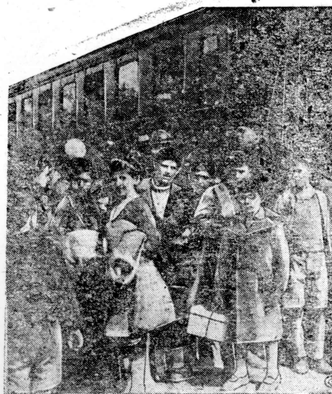
Эвакуированные из Бильяно бисские женщины и дети на вокзал в Ла-Паллис Рошель (Франция).