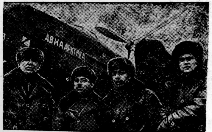
(Слева направо): Э. Т. Кренкель (радиот), И. Д. Папанин (начальник зимовки), Е. К. Федоров (астроном и магнитолог) и П. П. Ширшов (гидробиолог и гидролог).