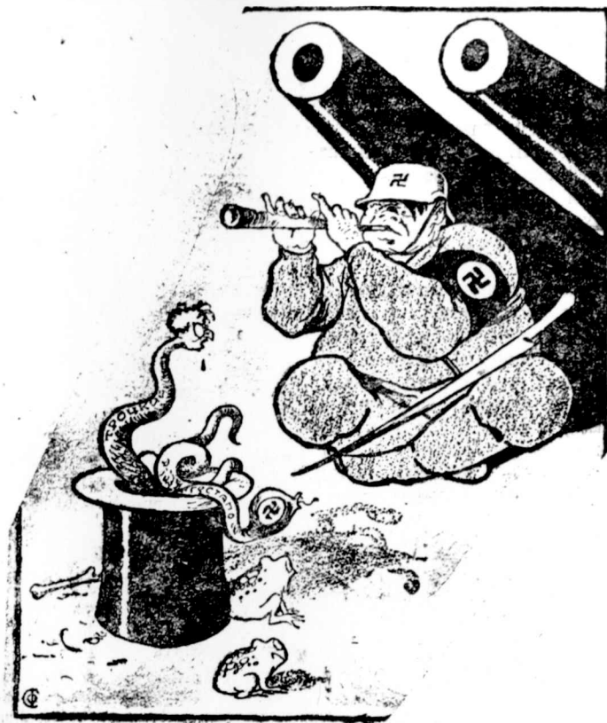
Заклинатель гадов.