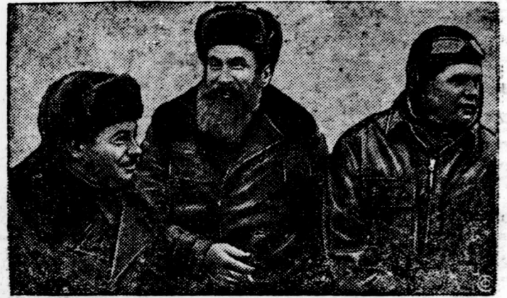
(Слева направо): герои Советского Союза тов. И. Д. Папанин, начальник Северной экспедиции тов. О. Ю. Шмидт и командир флагманского корабля „СССР Н-170“ герой Советского Союза тов. М. В. Водопьянов.