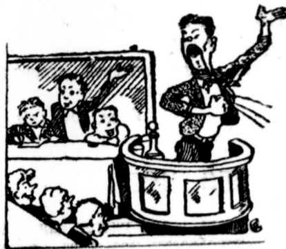
Профорг Заяц на собрании...

Зарвавшемуся бюрократу Заяцу не место среди профоргов групп.