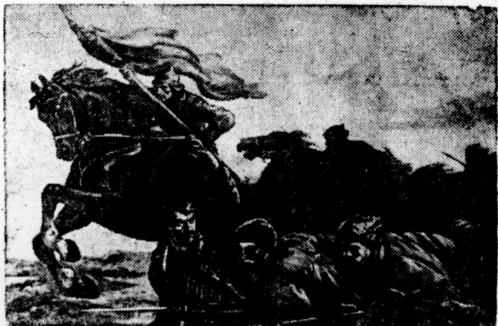
На снимке: „За советскую родину“. Картина художника И. М. Тойдзе. „20 лет РККА и Военно-Морского Флота“.

В Москве открылась художественная выставка картин „20 лет РККА и Военно-Морского Флота“. На выставке представлено около 450 произведений живописи, скульптуры и графики виднейших мастеров советского искусства.