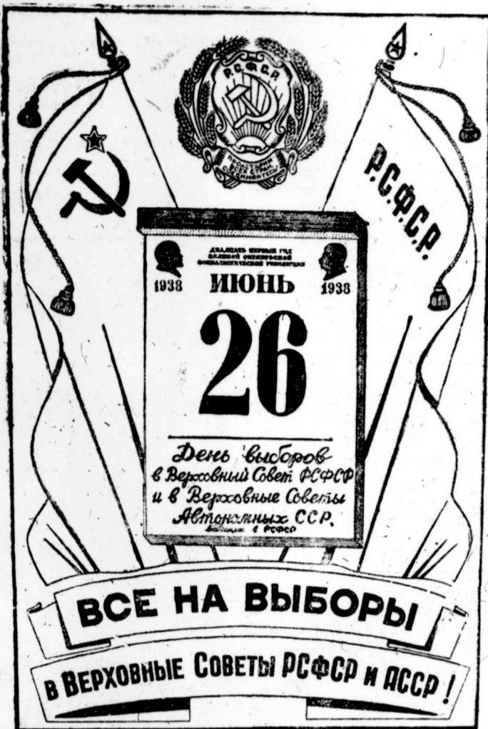
„Все на выборы в Верховные Советы РСФСР и АССР!“ Рис. „Прессклише“ с плаката Изогиза.