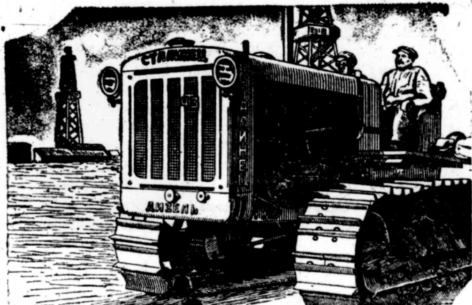
На снимке: Дизельный трактор на постройке вышек на промысле „Азизбековнефть“.

Дизельный трактор работает на тяжелом топливе, которое на 70—80 процентов дешевле нефте-топлива. Горючего дизельный трактор расходует значительно меньше.