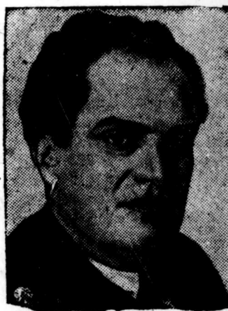
В. В. КУЙБЫШЕВ

7 июня исполняется 50 лет со дня рождения крупнейшего деятеля партии и советского правительства, члена Политбюро ЦК ВКП(б), председателя Комиссии Советского Контроля, заместителя председателя СНК СССР — Валериана Владимировича Куйбышева, злодейски умерщвленного фашистскими бандитами из „право-троцкистского блока“.