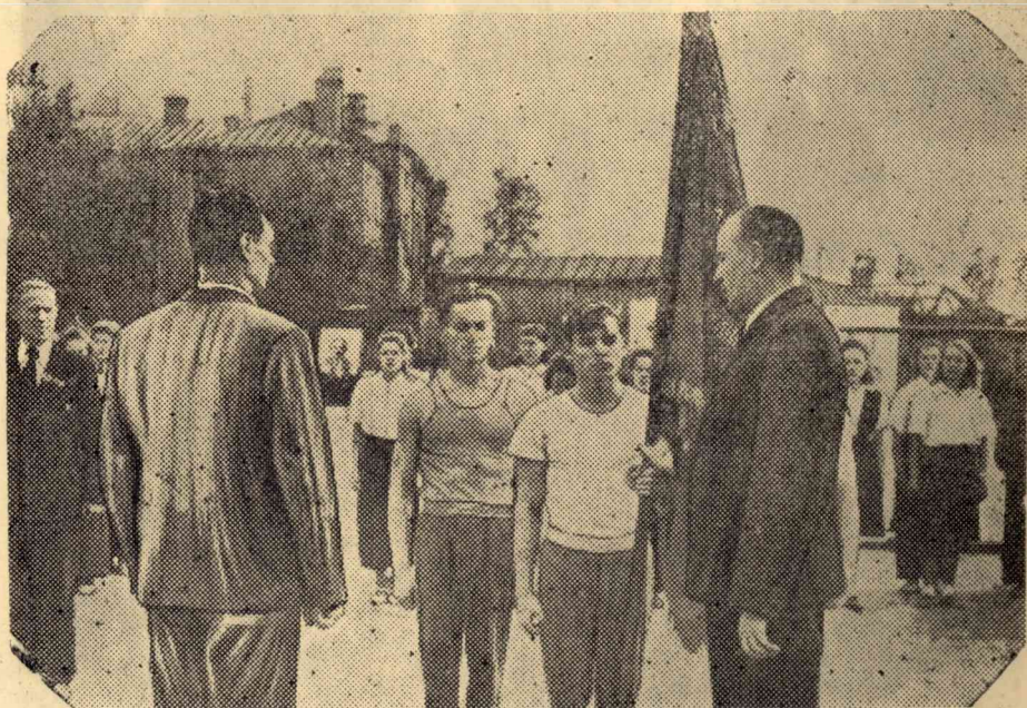
Спортивный коллектив нашего института — победитель в соревнованиях спортивных команд вузов г. Томска. Нашему институту вручено переходящее Красное знамя.