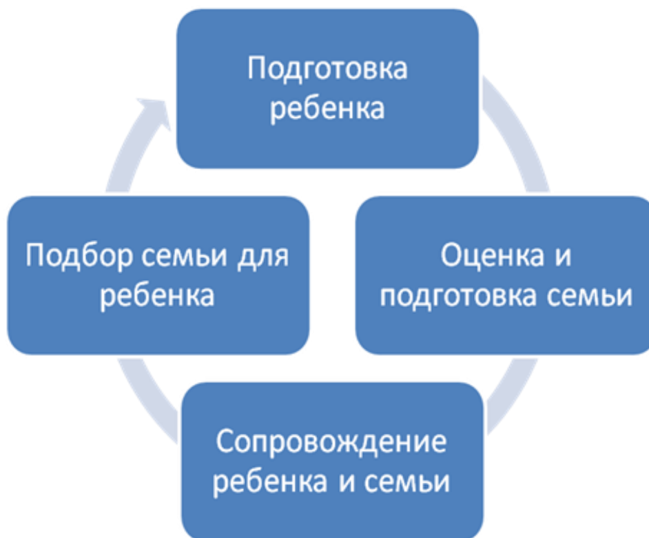
Рисунок 2 - Составляющие модели устройства детей в семью.

Если в данной организации будет проводиться весь комплекс вышеперечисленных работ, то можно считать, что цель будет достигнута. (Рис.2).