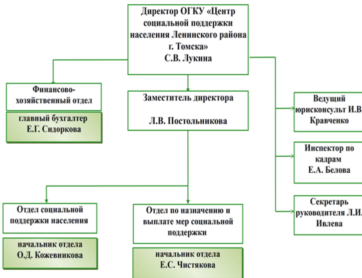
Рисунок 2 – Структура ОГКУ «Центр социальной поддержки населения Ленинского района г. Томска

Деятельность Учреждения осуществляется в соответствии с № 442-ФЗ от 28.12.2013 года «Об основах социального обслуживания граждан в Российской Федерации». Целью деятельности Учреждения является решение вопросов оказания семьям, детям и отдельным гражданам района, попавшим в трудную жизненную ситуацию, помощи в реализации их законных прав и интересов, содействия в улучшении их социального и материального положения, а также психологического статуса.