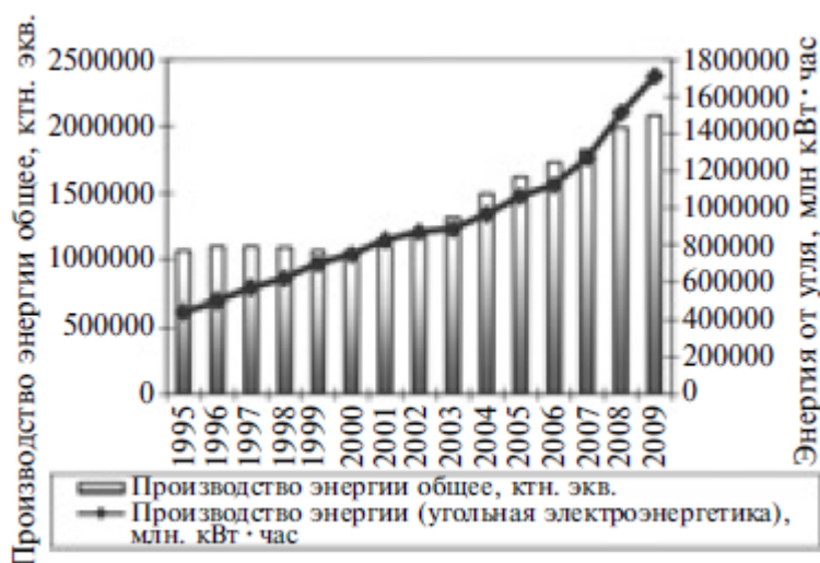
Диаграмма 1. Производство электроэнергии в Китае (общее и от сжигания угля) в 1995-2009 гг. 87

Говоря об использовании угля в качестве топлива, эксперты выделяют две основные проблемы: низкая эффективность сжигания угля, а также высокую долю непосредственного сжигания.