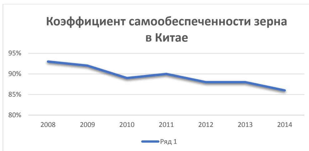
Диаграмма 3. Изменение уровня самообеспечения зерном в Китае 107

Проблема некачественных продуктов питания вызывает общественный резонанс по поводу их безопасности для организма человека. К примеру, в 2008 году произошел скандал по причине загрязненного состава детского питания, зараженной клубники в 2011 году, риса, загрязненного кадмием в 2013 году. Данная ситуация с продовольствием создает ряд основных проблем для многих домашних хозяйств в Китае. Продолжающаяся деградация качества внутреннего сельского хозяйства в сочетании с ростом