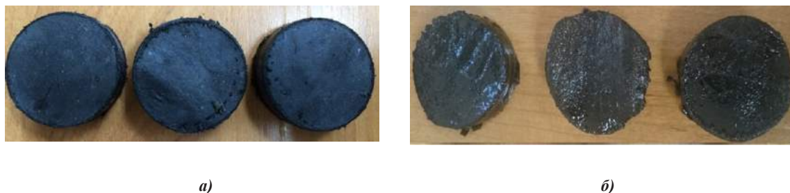
Рис. 3. Визуальный анализ образцов эластомера: а – до воздействия реагента, б – после воздействия реагента СНПХ-ПКД-515 при температуре 85°C

В результате проведенного исследования доказано негативное влияние ингибитора СНПХ-ПКД-515 на состояние образцов эластомера винтового забойного двигателя, изготовленных из резины ИРП-1226. Наблюдается интенсивное набухание и увеличение массы образцов под воздействием ингибитора с ростом температуры среды, за исключением крайних температурных точек, что обусловлено испарением ингибитора. Поэтому в качестве дальнейших исследований решено исследовать влияние данного ингибитора на эластомер при повышенных температурах и в условиях повышенной герметичности, а также проанализировать влияние концентрации реагента на интенсивность изменений, происходящих в эластомере.