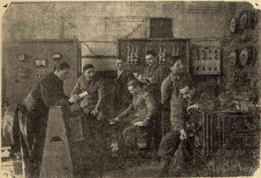
Бригада студентов 126 гр. в лаборатории электрических машин.