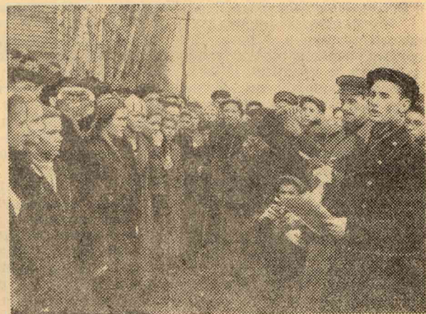
Фото и текст В. Казанцева.

☆☆ На снимках: Слева — старт эстафеты у главного корпуса института. Справа — вручение кубка команде-победительнице.