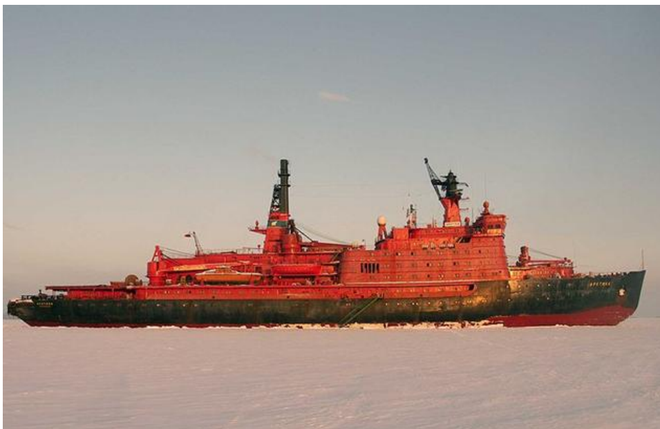
Рисунок 1. Первый атомный ледокол "Арктика"

В условиях обострившейся международной конкуренции в борьбе за ресурсы арктического шельфа существенно возрастает значение российского атомного ледокольного флота, как наиболее эффективного инструмента обеспечения транспортной и хозяйственно-экономической деятельности в Арктической зоне. Следует особо отметить, что только благодаря созданию мощных атомных ледоколов атомоходом «Арктика» (рис.1) в 1977 г. впервые в мире в активном плавании была достигнута географическая точка Северного полюса. К настоящему времени российские атомные ледоколы 65 раз посещали точку Северного полюса [1]