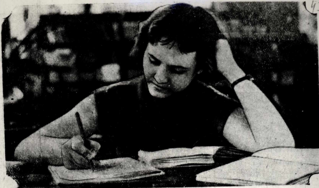
К первому экзамену.