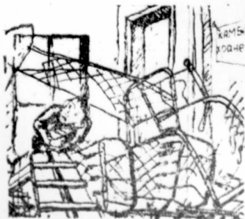
Рис. Н. Дедова.

В подобное положение может попасть каждый, кто рискнет пройти через вестибюль общежитий по ул. Усова, 13-а, 17, и некоторых других.