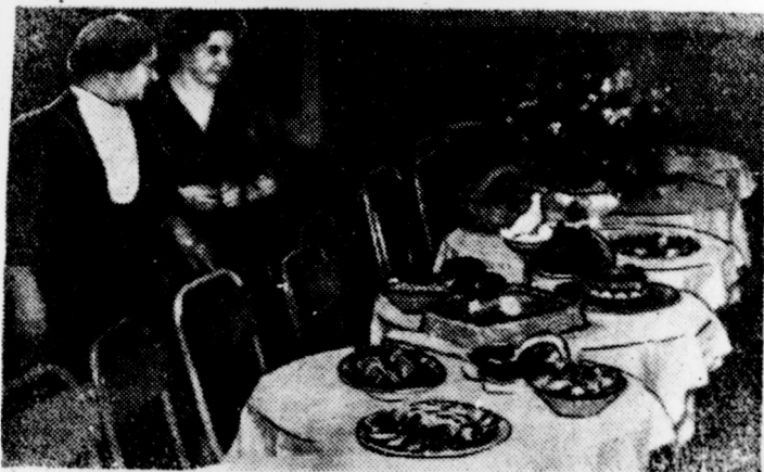
Большой интерес у посетителей вызвала выставка кружка кулинарии, организованная в клубе института 8 марта.

Ю. КУЗНЕЦОВ, член корреспондент АН СССР.