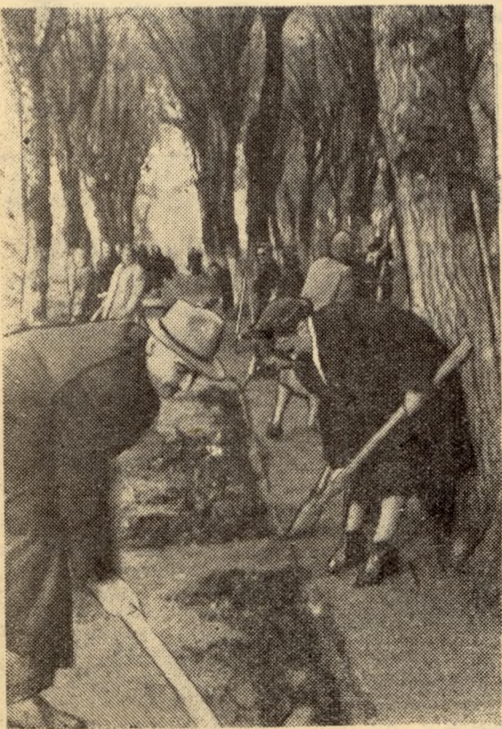
„За кадры“ 8 июня 1960 г., 2 стр.

На снимке: коллектив ХТФ приводит в порядок аллею около своего корпуса.