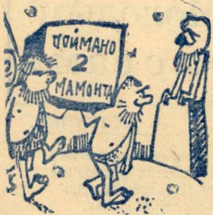
Из истории демонстраций...