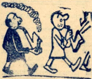
Саксофонист на пенсии.

А солнце — в этом друг ей лучший — Весной не может надвинуться: В зеркальной глади первых лужиц С подругой весело глядится. И в честь того, что взяли верх В борьбе с зимой (иначе как?), Пускает солнце фейерверк Веселых ярких, «зайчиков».