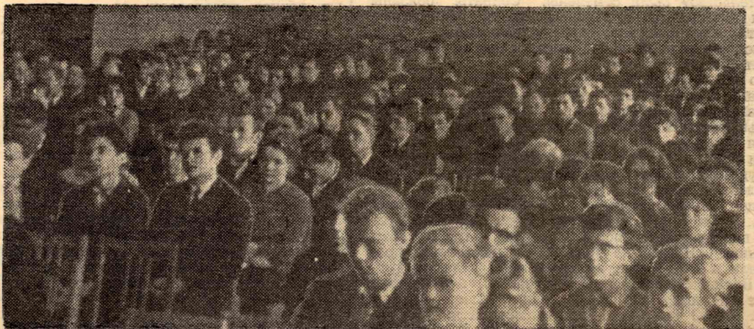
В зале конференции.