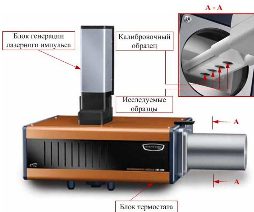
Рис. 1. Схема установки для определения теплофизических характеристик веществ.

Подготавливалась навеска порошков (средний размер частиц составил около 200 мкм) исследуемых материалов массой около 0,15–0,27 г и при помощи гидравлического пресса навески спрессовывались в образцы цилиндрической формы. Образцы при помощи держателя и специализированной тележки помещались в термостат. Рабочий объем термостата заполняется инертным газом (азотом).