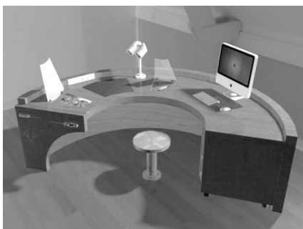
Рис. 3. Модель рабочего места в 3ds Max

конструкции и функционала рабочего места была выполнена 3d модель. Для создания 3d модели рабочего места используется программа Autodesk Inventor. Данная программа помогает тщательно проработать конструкторскую сторону проектируемого объекта, а именно функционирование составляющих, а также возможность существования разработки в действительности. Для более эффективной визуализации используется программа 3DsMax, которая позволяет детально проработать внешний вид проектируемого объекта, а также поместить его в любое окружение (рисунок 3).