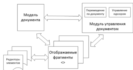
Рис. 2. Конфигурация компонентов

Веб-приложение работает непосредственно с моделью документа, предоставляет интерфейс и функционал для работы с ней. Приложение разбито на компоненты, так называемые «чёрные ящики», имеющие интерфейс для взаимодействия друг с другом, но скрывающие внутреннюю реализацию. Таким образом, компоненты могут добавляться, изменяться и тестироваться без необходимости менять всю архитектуру приложения. Схема взаимодействия компонентов представлена на рисунке 2.