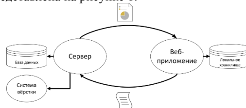
Рис. 1. Общая структура системы

Система должна состоять из двух частей: клиентской части, работающей в браузере пользователя, и серверной части, работающей на отдельном сервере. Общая структура системы представлена на рисунке 1.