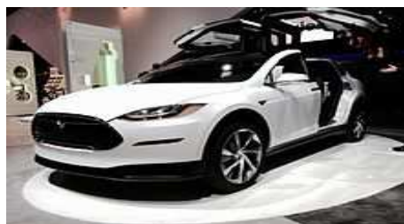
Рис. 1. Tesla model X

Дома в скором времени сами будут производить энергию, причём больше, чем её потребляют. По крайней мере, к этому стремятся учёные. Так Германия представила разработку «Эффективный дом плюс». Здесь используют фотогальваническую установку. На выставке экспозиция представляет собой абстрактное здание. Однако в жизни оно выглядит очень современно и презентабельно. Очень умный «зелёный» дом представили в павильоне Словакии. Экокапсула. Он сочетает в себе все возможные «зелёные» технологии. Панели на крыше позволяют использовать энергию солнца. Такой дом не требует никаких коммуникаций.