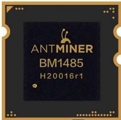
Рис.2. Чип BM1485 для майнинга [3]