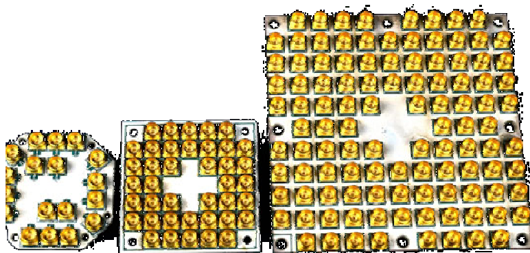
Рис. 1. 49-кубитный квантовый чип [2]

Квантовые вычисления позволят по экспоненте нарастить производительность вычислений без значительного увеличения потребления, поскольку каждый кубит одновременно может быть и 0, и 1. Увеличивать производительность кубитами - квантовыми битами - гораздо выгоднее, чем битами. Благодаря свойству суперпозиции кубитов, добавив всего один разряд, мы можем получить не только крайние значения, но и множество промежуточных состояний. Основная проблема тут ровно одна - научиться программировать в рамках квантовой математики.