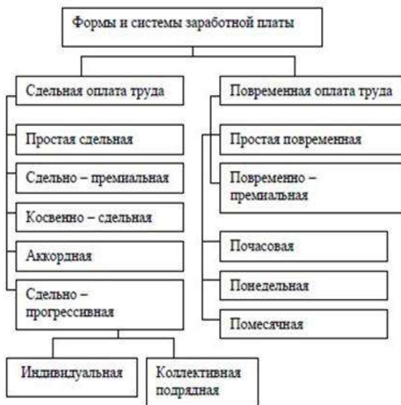
Рисунок 1 – Формы и системы оплаты труда. [8, с. 10]

Рассмотрим формы и системы оплаты труда: