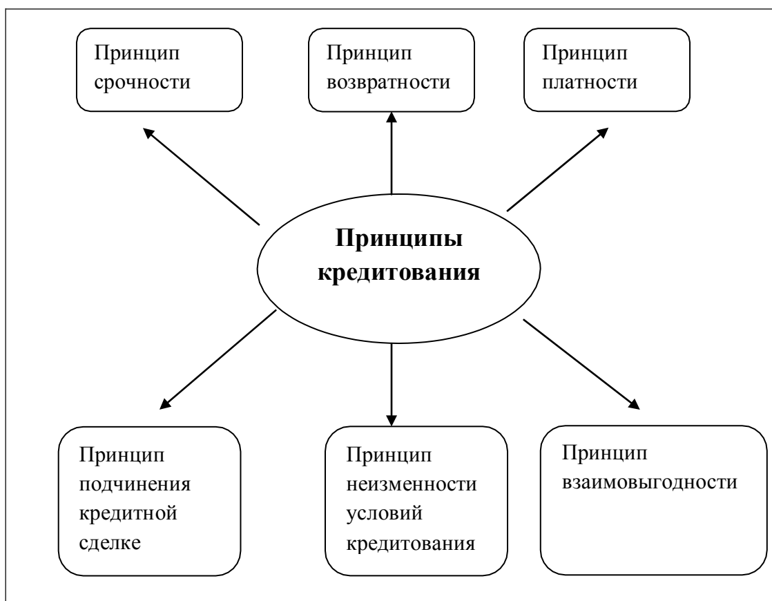
Рисунок 3 – Принципы кредитования в коммерческом банке

Исходя из этого, можно считать, что имеются безусловные принципы кредитования: