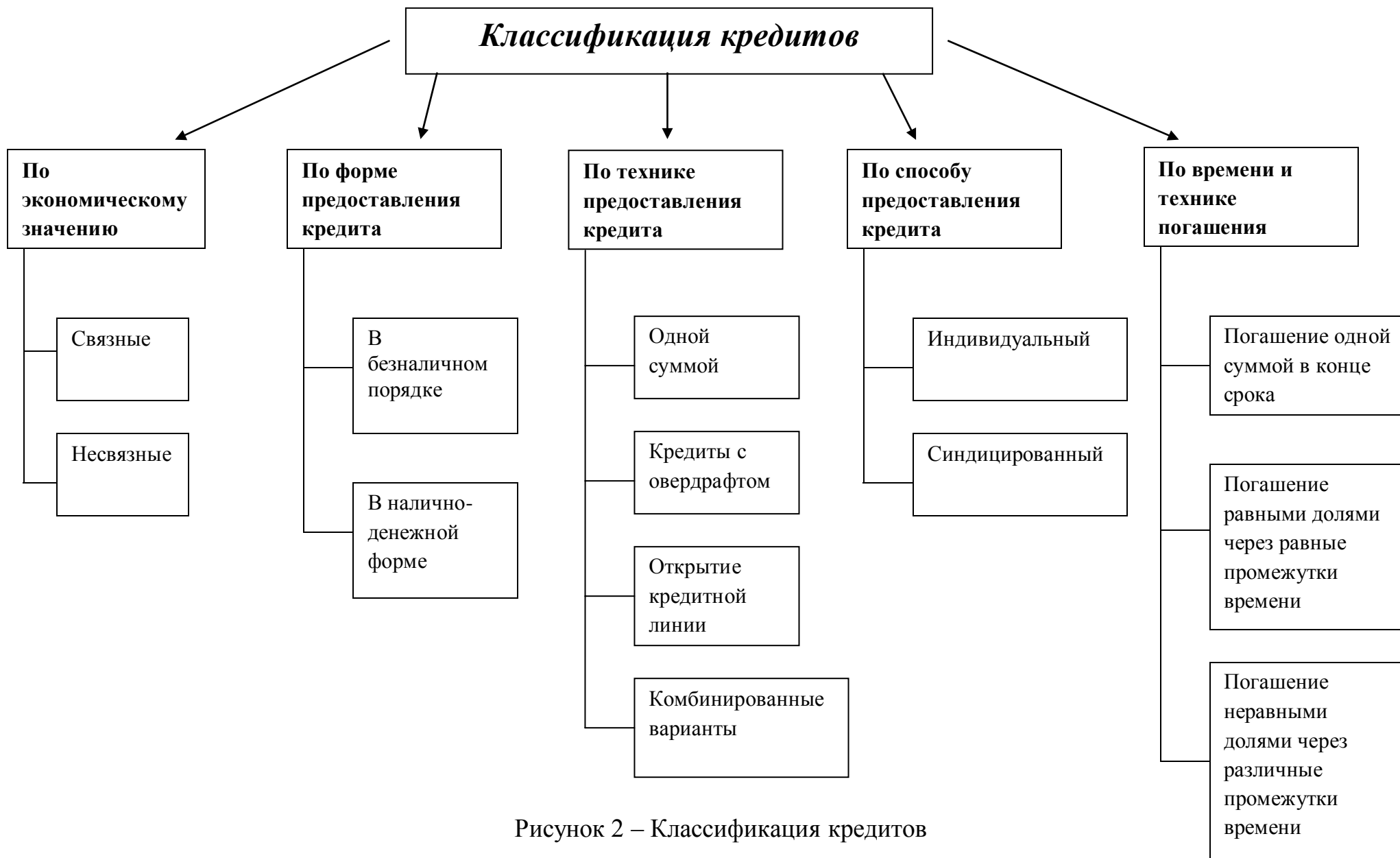
Рисунок 2 – Классификация кредитов