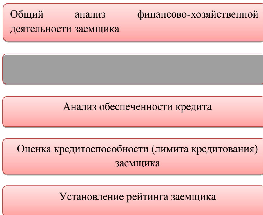
Рисунок 4 – Анализ кредитной заявки

На каждом из этих шагов сотрудники банка последовательно конкретизируют и уточняют свои представления о потенциальном заемщике, параметрах возможного кредита, в частности, о реальном размере рисков, которые банк примет на себя, если выдаст испрашиваемый кредит.