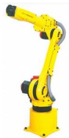
Рисунок 6 - Робот-манипулятор Fanuc

Основное назначение робота-манипулятора перемещение оптической головы и сварочной горелки. Так же в софт робота связывает все компоненты установки через выходы (OUT) в одной программе, что облегчает управление. Назначаем робот-манипулятор Fanuc.