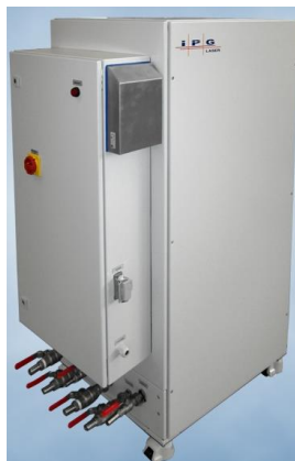
Рисунок 4 – Чиллер

Для охлаждения компонентов волоконного лазера ЛС-8 назначаем чиллер LC 170-01.W.3.5/6 (рисунок 4).