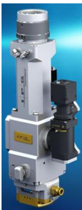
Рисунок 5 – Лазерная голова

Оптическая голова предназначена для фокусировки лазерного излучения для сварки (рисунок 5). Назначаем голову для сварки FLW D50.