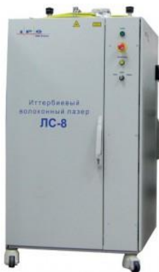
Рисунок 3 – Лазер ЛС-8

Линейка мощных и сверхмощных промышленных волоконных лазеров включает в себя модели от 100 Вт до десятков кВт.