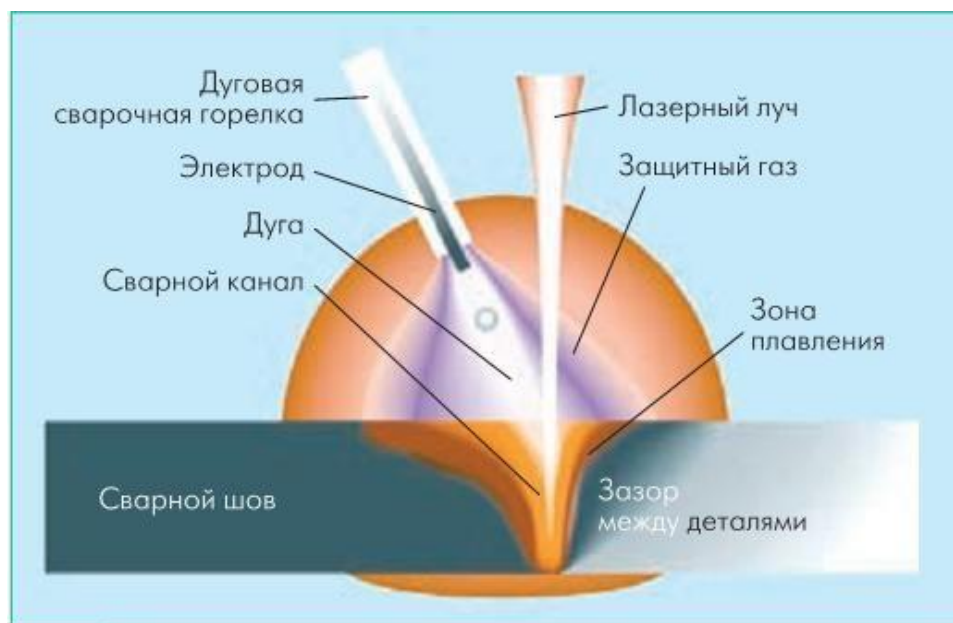
Рисунок 2 – Схема гибридной лазерно-дуговой сварки

Исходя из анализа достоинств и недостатков гибридных способов сварки, проведенных в п. 1.2 в качестве основного способа сварки была выбрана лазерно-дуговая сварка. Схема сварки показана на рисунке 2.