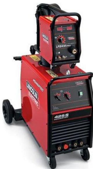
Рисунок 7 – Источник питания для сварки и механизм подачи проволоки

Назначаем в качестве источника для дуговой сварки аппарат Lincoln Electric Powertec 425S со встроенным механизмом подачи электродной проволоки.