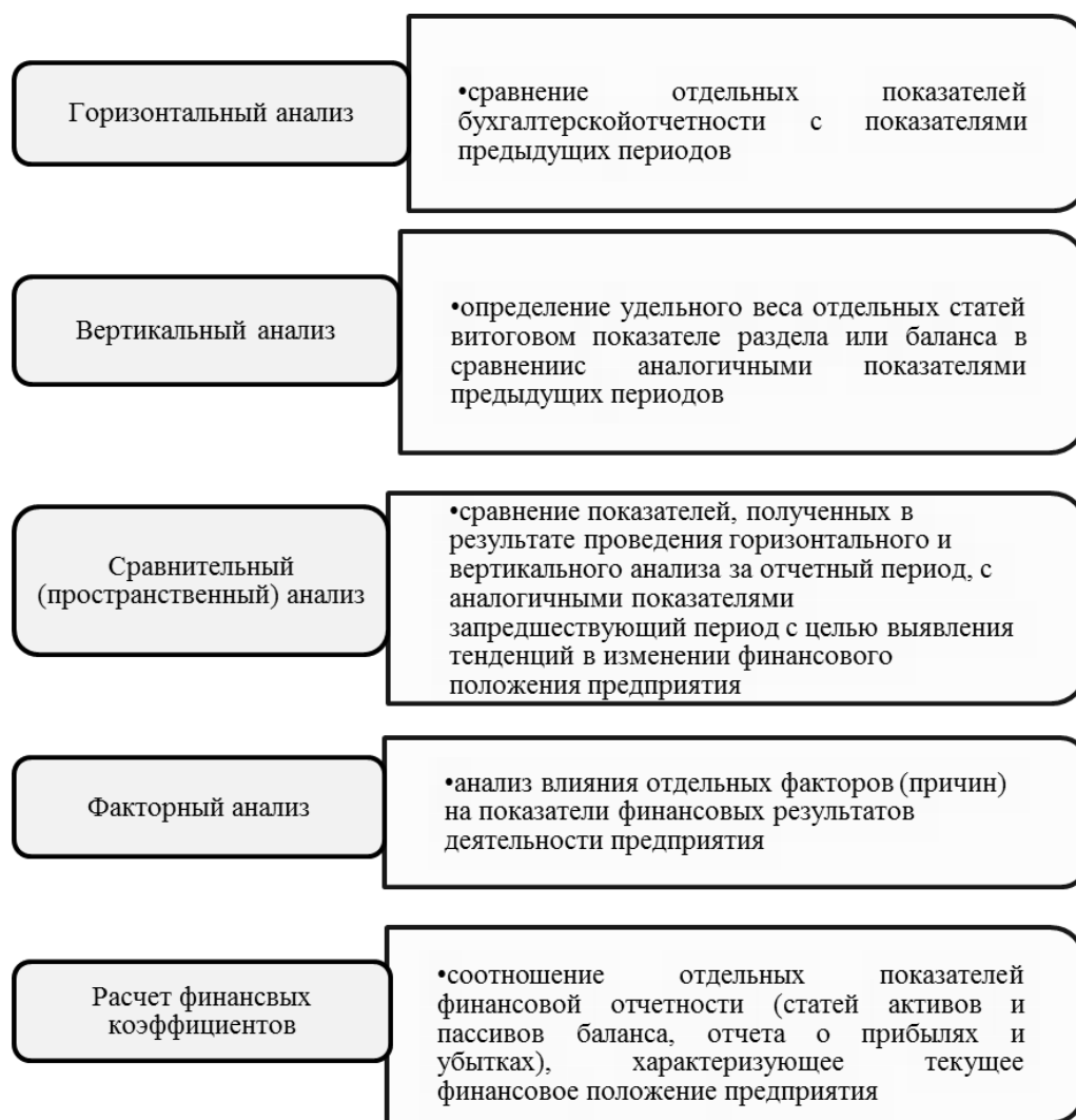
Рисунок 3 – Виды финансового анализа предприятия

Классическим способом анализа является именно анализ и диагностика финансового состояния организации по данным бухгалтерской отчетности. Этапы проведения классического анализа, следующие: