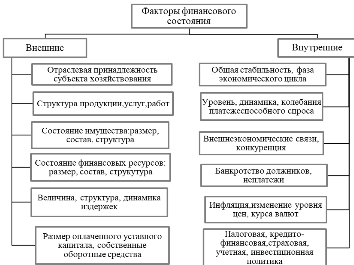
Рисунок 2 – Факторы финансового состояния предприятия

Основные принципы анализа финансовой деятельности предприятия представлены в таблице 2.