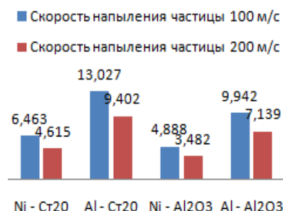
Рисунок 2 – Толщина сплета 10^{-6} м для разных систем для двух скоростей напыления