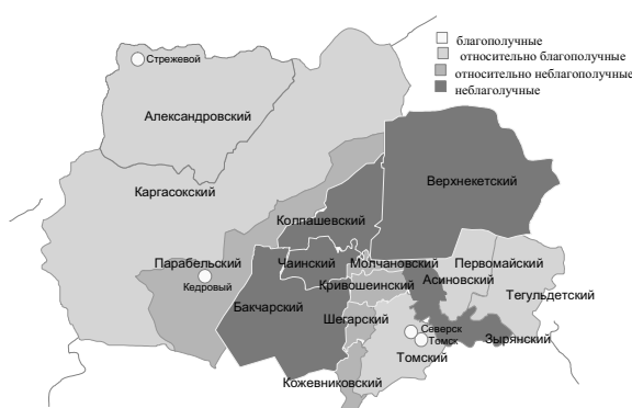
Рис. 2. "Карта бедности" Томской области

В рамках Стратегии предусматривается решение следующих задач: