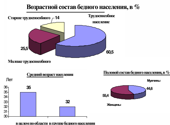
Рис. 1. "Портрет бедности" на территории Томской области

"Портрет бедности" на территории Томской области представлен на рис. 1.