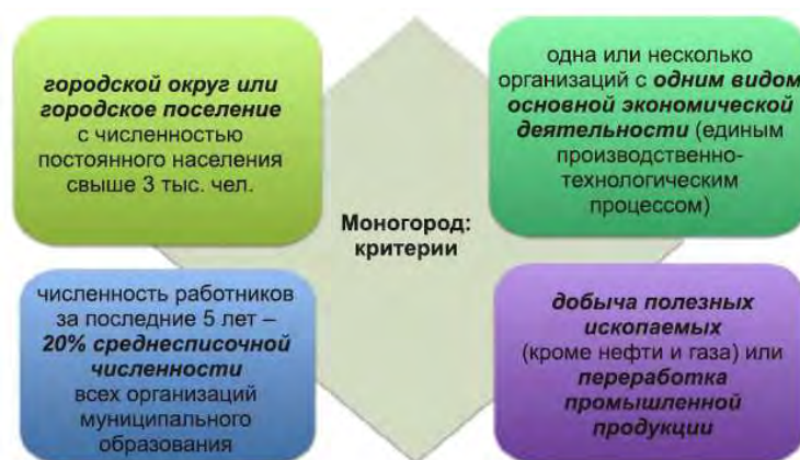
Рис. 1. Критерии включения моногородов в список монопрофильных населенных пунктов

Основываясь на работы, которые посвящены понятию «моногород», а также на эволюцию данного понятия от манипулирования отдельными критериями выделения моногородов до составления официального списка таких городов на основе совокупности критериев, можно выделить базовые критерии отнесения населенного пункта, которые закреплены последними изменениями законодательства (рисунок 1).