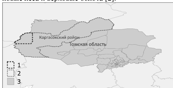
Рис. 1. Расположение исследуемой территории: граница Васюганского лесничества (1), граница Каргасокского района (2), территория Томской области (3)

Исследуемая территория, расположение которой приведено на рис. 1, характеризуется слабой устойчивостью экосистем к внешним факторам, ландшафт территории определяется взаимопроникновением лесных и болотных выделов, преобладают темнохвойно-мелколиственные леса, сосновые леса и верховые болота [2].