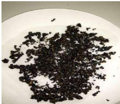
Рис. 1 Механические включения

Зачастую на месторождениях стоят пластинчатые фильтры, которые требуют систематической очистки. Проводя обследование дренажных стоков с таким фильтром, зачастую обнаруживается песок (рис. 1).