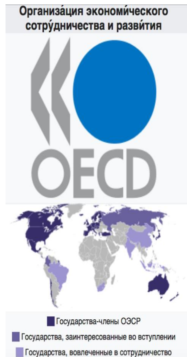
Рис. 3. Организация экономического сотрудничества и развития (ОЭСР) [3]