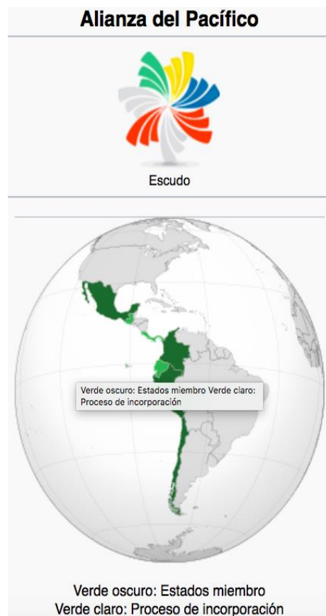
Рис. 6. Тихоокеанский Альянс [6]