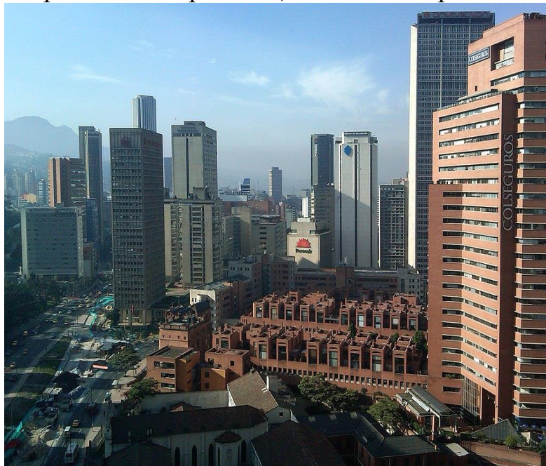
Рис.1. Международный центр Боготы [1]

Колумбия является страной со средним и высоким уровнем дохода, что подчеркивается на международной арене значительным экономическим ростом, который она пережила за последнее десятилетие. Колумбия является четвертой по величине экономикой Латинской Америки после Бразилии, Мексики и Аргентины.