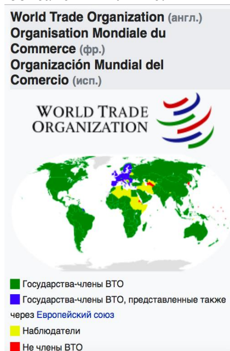
Рис. 2. Всемирная торговая организация ВТО [2]

рыночной экономикой (таких стран, как Индонезия, Вьетнам, Египет, Турция и Южная Африка). На континентальном уровне в состав Колумбии входят такие организации, как Межамериканский банк развития (МАБР), Андское сообщество наций (Кан), Союз южноамериканских наций (УНАСУР) и, в последнее время, Тихоокеанский Альянс.