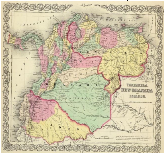
Рис. 7. Карта 1854 год

промышленностью и импортирующими торговцами, которые развивались параллельно с процессом расширения сельскохозяйственных границ, что воплотилось в таких явлениях, как Антиокская колонизация и развитие инфраструктуры.