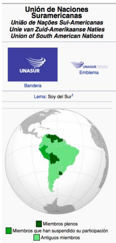
Рис. 5. Союз южно-американских наций (УНАСУР) [5]