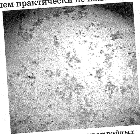
Рис. 2. Микробные пейзажи автотрофных железобактерий на покровных стеклах обрастания суточной экспозиции (оз. Боярское). Увеличение 80х

Непосредственно над илом образовался слой бурого цвета толщиной 7-11 мм, состоящий из гелеподобных, почковидных и гроздьевидных агрегатов (до 2,5 мм) гидроксидов железа. Изредка в этом слое наблюдались округлые выделения гидроксидов марганца. Микробиологическими исследованиями в рассматриваемом слое выявлены автотрофные и гетеротрофные железобактерии.