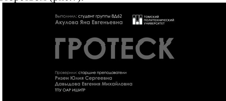
Рис.7. Заключительный кадр

Видеоролик завершается кадром с продублированным названием проекта и авторством (рис.7).