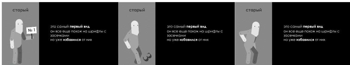
Рис.4. Анимация персонажа «старый гротеск»

Для создания смыслового кода ключевые понятия в тексте выделены с помощью применения полужирного начертания [4]. Элементы, на которые следует обратить внимание, подсвечиваются красным или оранжевым цветом (в соответствии с решением цветовой палитры проекта), так же для привлечения внимания используется мерцание элементов (рис.5).