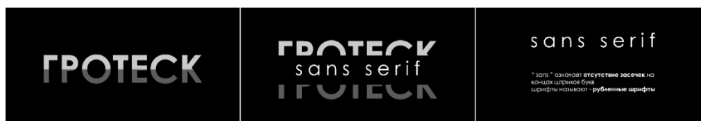
Рис.2. Переход от вступительной анимации к общей информации о гротесках.

Вступительная анимация помимо своих основных целей выступает в качестве подводки ко второму действию, а именно представлению общей информации о гротесковых шрифтах (рис. 2).