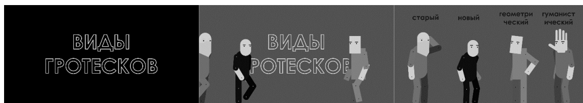
Рис.3. Сцена с представлением персонажей

На смену общей информации о гротесках появляется основная часть, в которой происходит деление на стилистические подвиды представленного шрифта с дальнейшим рассмотрением каждого. В этой части сконцентрировано самый большой объем рассматриваемой информации, а для более эффективного восприятия предложена фиксация на зрительных образах четырех персонажей, олицетворяющих четыре вида гротесковых шрифтов (рис.3).