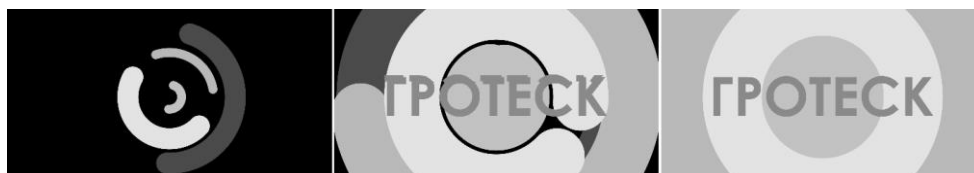
Рис.1. Вступительная анимация.

Для начала видеоролика было решено создать вступительную шейповую анимацию, простую, но при этом притягивающую внимание. Так же для привлечения внимания (в особенности возрастной категории людей, для которых создавался данный ролик) было принято решение о добавлении «глитч эффекта» – эффекта искажения и повреждения изображения [3]. Данный эффект пользуется особой популярностью и является одним из трендов текущего года. На протяжении данного проекта эффект будет использован в качестве переходной анимации между изображениями. Так же вступительная часть должна содержать в себе название рассматриваемой далее темы (рис.1).